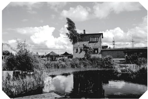
Летом 2022 года художники жили и на первом этаже хозяйственного здания, пустовавшего до этого несколько десятилетий.

В первом сезоне все было новым и интересным. Благодаря руководству гаражного товарищества нам удалось разместиться в одном из гаражей и на первом этаже хозяйственного здания. Оба помещения нужно было приводить в порядок, чтобы там могли жить иностранные художники. Внутренние стены гаража были покрашены, помещение было обставлено мебелью. Обустройство первого этажа заняло несколько дней – мы открывали глухие окна, несколько раз подряд мыли все поверхности – окна, полы и стены.