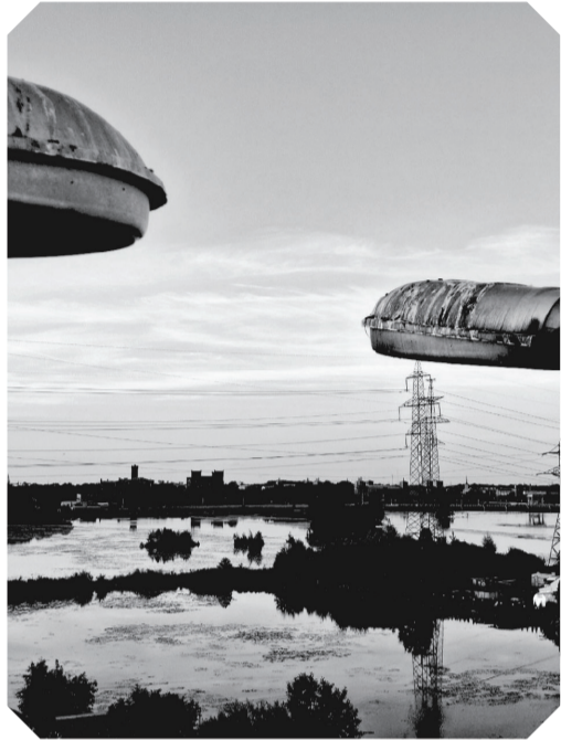
Вид на восток с башины на территории насосной станции.

Летом 2022 года в Нарве начался проект «Посольство Нарвской Венеции», в 2024 проходил его третий сезон. Посольство – это место, где художники могут общаться и знакомиться с жителями Нарвы, а жители Нарвы в свою очередь узнавать о работе международных художников. Проект был назван “Посольством”, поскольку он представляет международных художников и их проекты среди нарвских дач и гаражей.