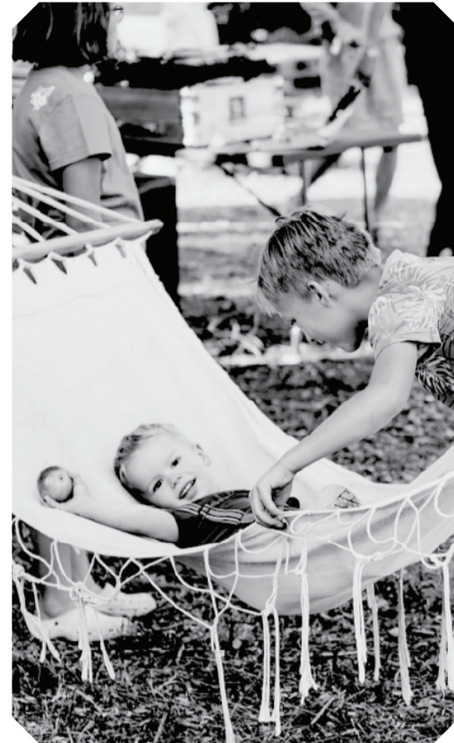
Посетители на вечеринке Venice Annuale, которая прошла в начале сентября во время фестиваля Station Narva.