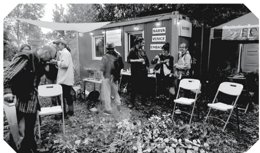
Летом 2023 некоторые из художников жили в блок-контейнере.