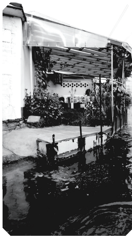
В Нарвской Венеции встречаются ухоженные и красивые мини-сады.

Американский художник Мохар Калра создавал скульптуры животных из дерева. В них были установлены динамики, соединённые с микрофоном. Я была под большим впечатлением после прослушивания записей с микрофона, нам открылась скрытая часть жизни жителей Кулгу. Дети читали стихи, кто-то слушал музыку с телефона. Были те и кто нецензурно ругался, другие обсуждали актуальные политические проблемы. Я никогда не думала, что жители Кулгу так тепло примут эту художественную инсталляцию.